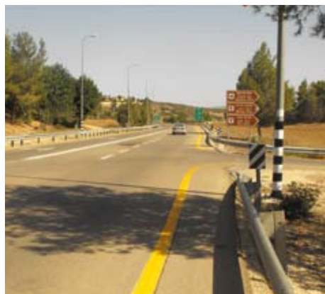
פנייה לא בטוחה לפארק עדולם