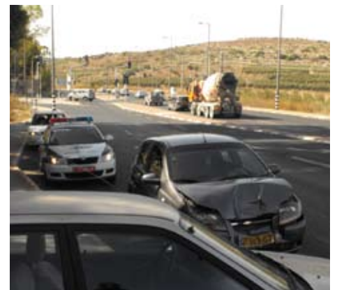
תאונת דרכים בשידור חי. ברקע תל בית שמש

לסיכום: זהו כביש נאה אך די מסוכן. אנו ממליצים לנהיג משאיות לא להתפתות לנסיעה מהירה למרות שזה קיים בחלקים מסוימים שלו. יש לקחת בחשבון ש"הרעה" עלולה לבא מצד מטיילים רבים על שבילי העפר המתפרצים אל הכביש. טוב תעשה החברה הלאומית לדרכים אם תדוור בשיפור ושדוור הכביש כולו. הציון שלנו לכביש 7. בתום העבודה הרמנו שוב טלפון לרחל מ"תגיידו לי" וביקשנו המלצה מהירה למקום המגיש שקשוקה ראווה על ציר 38. הופנינו על ידיה למסעדה מתוקה ושקטה הנחבאת אל הטבע בסביבות צומת אשתאול. ההמלצה הייתה מוצדקת וכך גם השקשוקה. סעו בהיחזות.